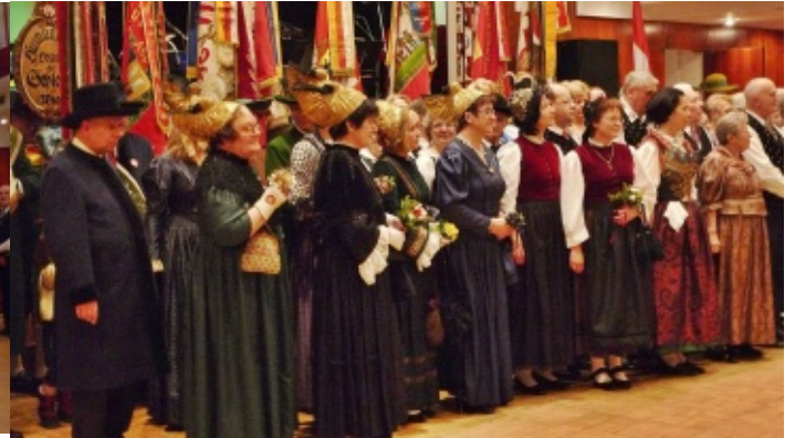
9. Ball der Heimat Trachtenabordnungen aus allen Teilen Österreichs