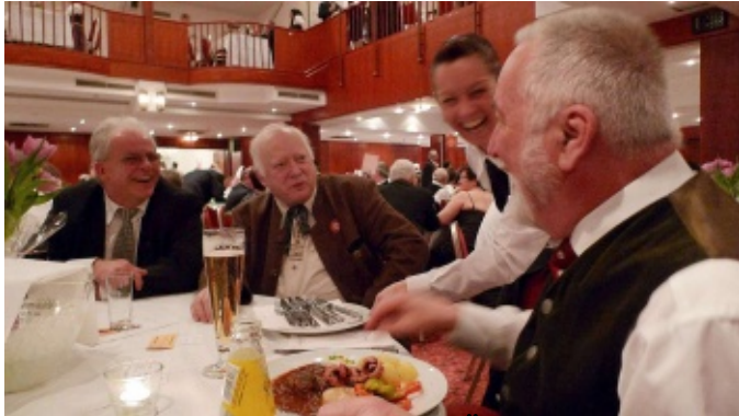
Siebenbürger, Landesrat und OLM an einem Tisch