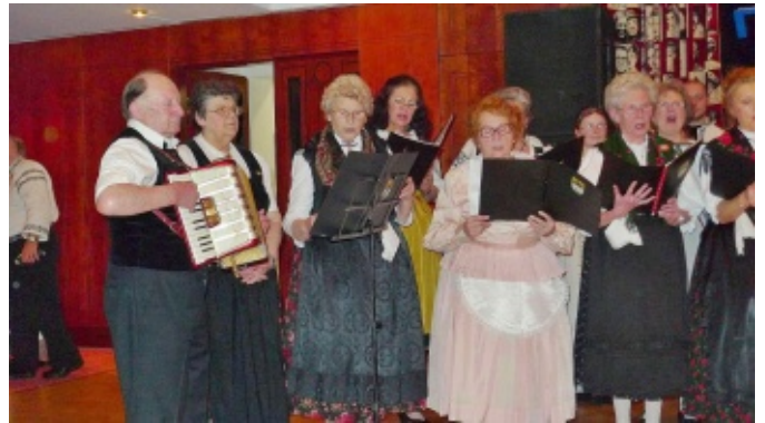
Der Donauschwäbische Chor aus Wien