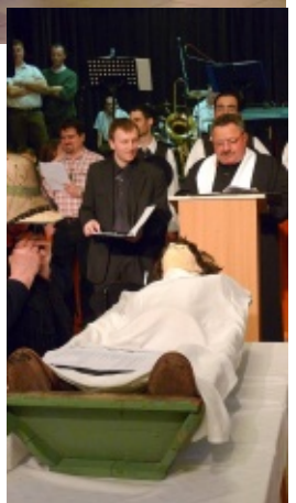
Fasching in Kleinturwall

FASCHINGSTREIBEN UND BEGRABEN IN HARAST 2011