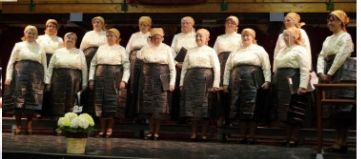
25. Jahre Frauenchor in Sankt Iwan, mit dem Gemischten Chor von Sanktiwan, Nemeth-Gallus Duo, Wetschescher Nachtigallen, Chor aus Schaumar,