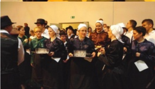
13. Jahre SAARER TANZGRUPPE aus dem Programm